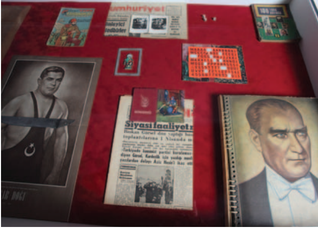
100 Ünlü Türk, detay, 2008, Rampa Galerisi'nin izniyle