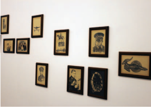
Yurttan Sesler (Vol. 1 Melankoli), 2009-2010, 39 adet kağıt üzerine karakalem, çerçeveli desen, Rampa Galerisi'nin izniyle