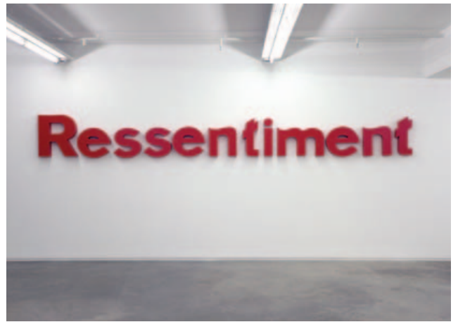
Hıç, 2009-2011, MDF üzerine kırmızı lake boya, Rampa Galerisi'nin izniyle