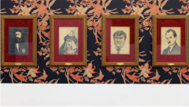
100 Ünlü Türk, detay, 2008