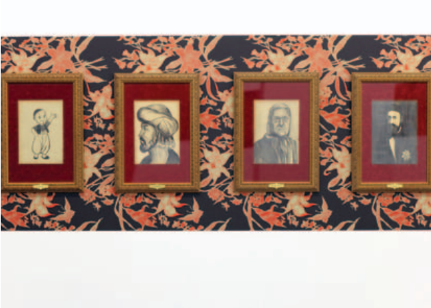
100 Ünlü Türk, detay, 2008