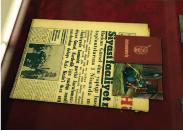
100 Ünlü Türk, detay, 2008