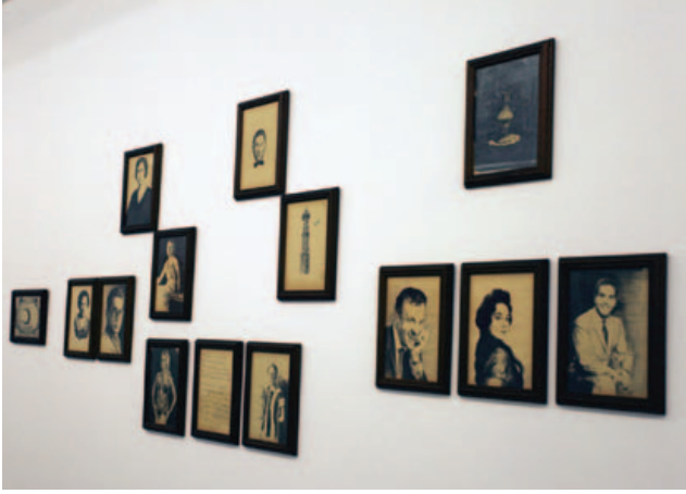
Yurttan Sesler (Vol. 1 Melankoli), 2009-2010, 39 adet kağıt üzerine karakalem, çerçeveli desen