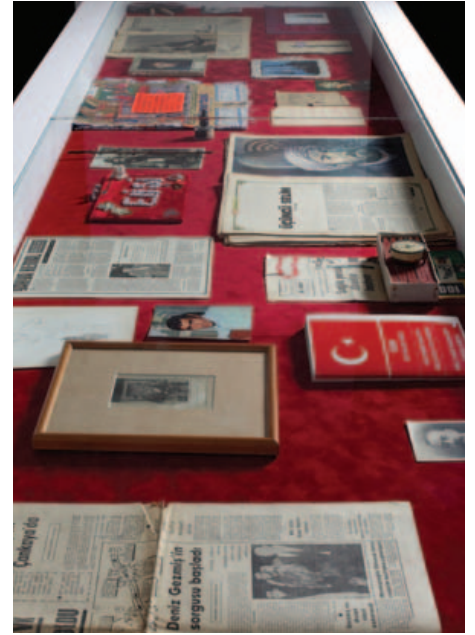
100 Ünlü Türk, detay, 2008